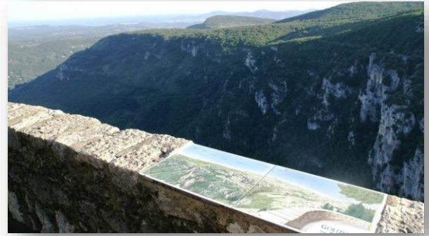
Belvédère de la place Victoria