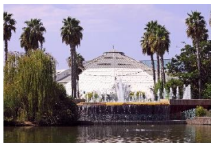
Le Parc PHOENIX

Situé à l'entrée de NICE, s'étend sur 7 hectares. 2500 espèces de plantes, dont certaines réputées rares, sont préservées dans un décor méditerranéen. La serre tropicale de 7.000m 2 et de 25 m de haut est une des plus grandes d'Europe.