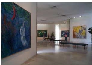
MUSEE NATIONAL MARC CHAGALL

Des scènes bibliques illustrées sur 17 grands tableaux, sculptures, vitraux, mosaïques et tapisseries, 205 esquisses préparatoires, 39 gouaches (1930), 105 gravures (1956) et 215 lithographies.